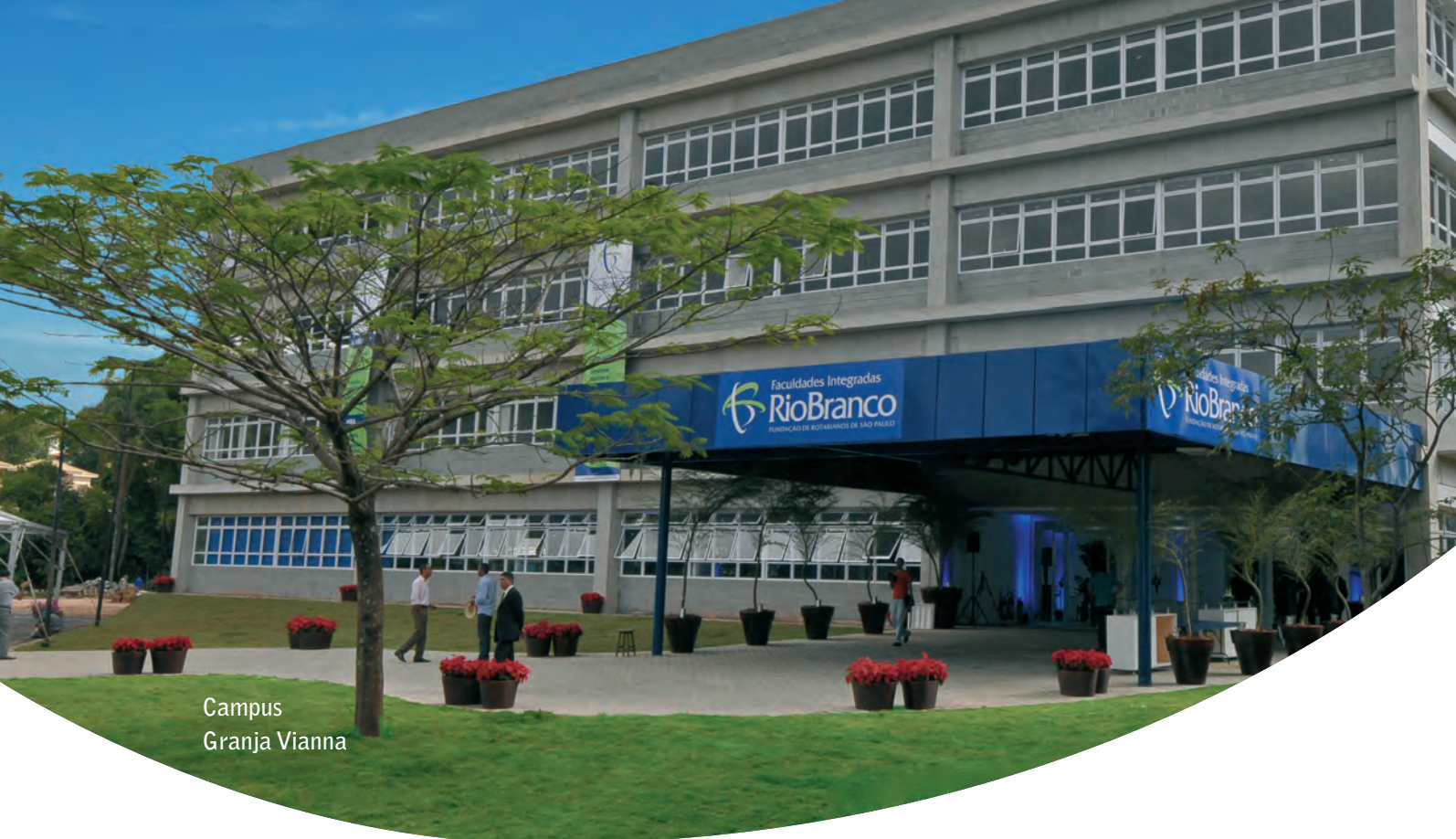
Campus Granja Vianna