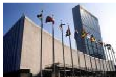
1945 - 1º de maio, São Francisco/1952 - Nova York