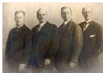
1904 - Chicago, o começo

www.rotary.org.br www.objetivosdomilenio.org.br